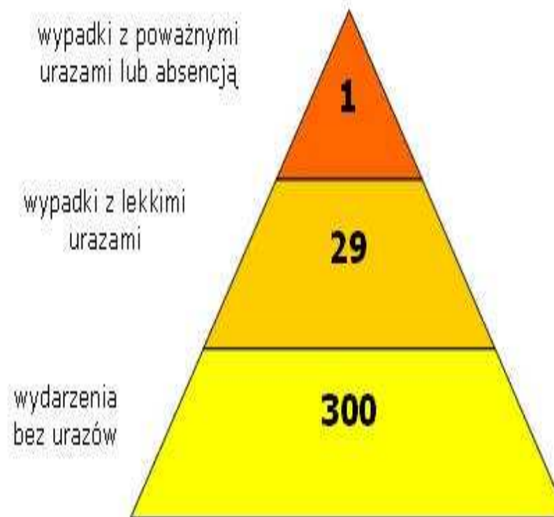
Trójkąt relacji zdarzeń wypadkowych według Heinricha